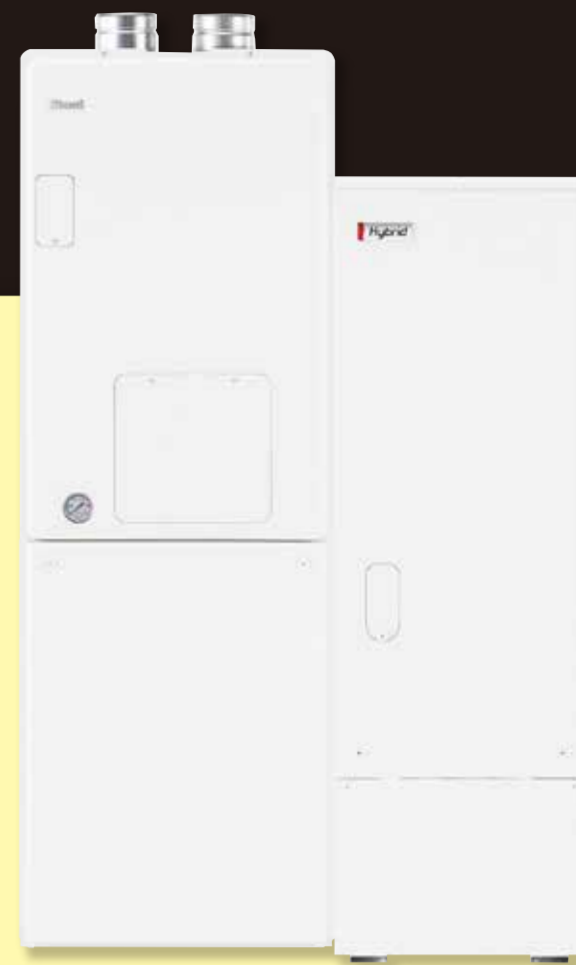
VIVIDO/ヴィヴィッドは、エアウォーター株式会社の「商標登録」商品です。