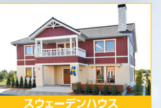
スウェーデンハウス