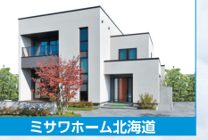
ミサワホーム北海道