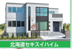
北海道セキスイハイム