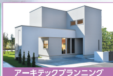
アーキテックプランニング