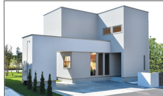
アーキテックプランニング ☎ 0166-74-3211