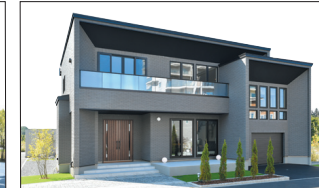
日本ハウスHD 日本ハウス事業部 ☎ 0120-10-0404