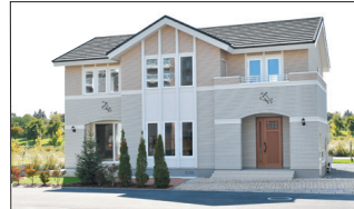
日本ハウスHD J・エポックホーム事業部 ☎ 0166-76-6313