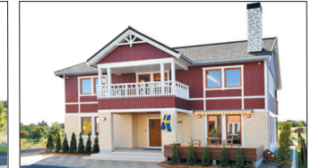
スウェーデンハウス ☎ 0166-31-2676