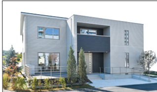
一条工務店 i-smart ☎ 0166-37-7851