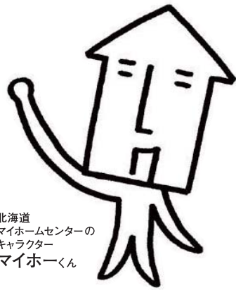
北海道マイホームセンターのキャラクターマイホームくん