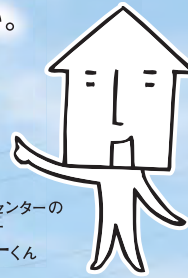
北海道マイホームセンターのキャラクター「マイホームくん」

「住宅展示場って興味はあるけどちょっと行きにくい」と迷っている人や、 「住宅展示場はマイホームを建てる人だけが行くところ」と思っていないか。 たくさんのモデルハウスが一度に見学できる住宅展示場は マイホームの夢を広げてくれます。 以下のよくあるQ&Aも参考に、もっと身近に、もっと楽しく、 北海道マイホームセンターを上手に活用してください。