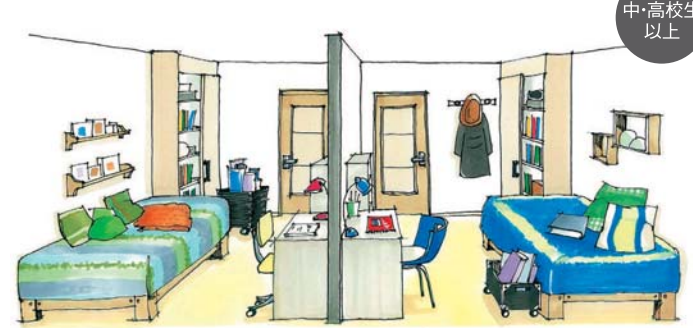
自立に向けて間仕切り壁で個室化。壁は将来、撤去可能なつくりしておく。間仕切り収納は分割し、再利用する

※子ども部屋のイラストは「北海道発 Only Oneの家づくり」北海道新聞社発行より