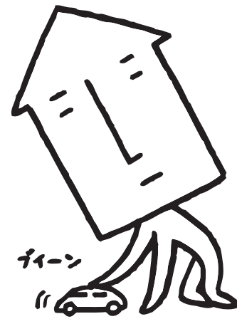
北海道マイホームセンターのキャラクター「マイホームくん」

成長を視野に入れたり、独立後の事も考えアレンジ可能な空間と考えることも一案です。