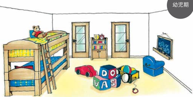
ワンルームで遊びの大空間を確保。ドアは透過性のあるタイプだと、様子が分かり安心