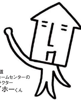
北海道 マイホームセンターの キャラクター マイホームくん